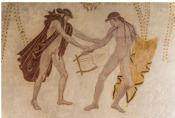
4 Hermes giver lyren i gave til Apollon

Traditionelt betragtes lyren som et folkemusikinstrument fra oldtiden brugt sammen med digteres fremføring af poesiværker. Den forbindes med den græske solgud Apollon - der også er guden for musik og poesi. Men det er den olympiske konkurrence- og sports-gud, Hermes - der også forbindes med handel, købmandskab og tyveri - som skulle stå bag selve opfindelsen af instrumentet. Ifølge mytologien skabte han den samme dag han blev født i en hule - hvor han boede med moren, nymfen Maia - ud af et skildpaddeskjold og med udspændte fåretarme som strenge. Myten beskriver, at Hermes forærede lyren til Apollon for at mildne hans vrede, efter at have stjålet Apollons kvæg.