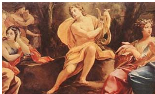
2 Apollon og muserne

I antikken var lyrens strengetoner og digtekunst uadskillelige. Gennem mange århundreder var musik akkompagneret af digtoplæsninger. Ved at give rum til en dialog mellem to kunstarter efterlyses et samlende kunstudtryk, der fuldbyrdes i mødet med publikum, som således indgår i dialogen, der foregår på scenen.